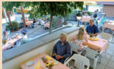
Bei schönem Wetter (warm bis heiß) schleckt gerne draußen man sein Eis oder hebt die Kaffeetasche auf der neuen Freiterrasse.