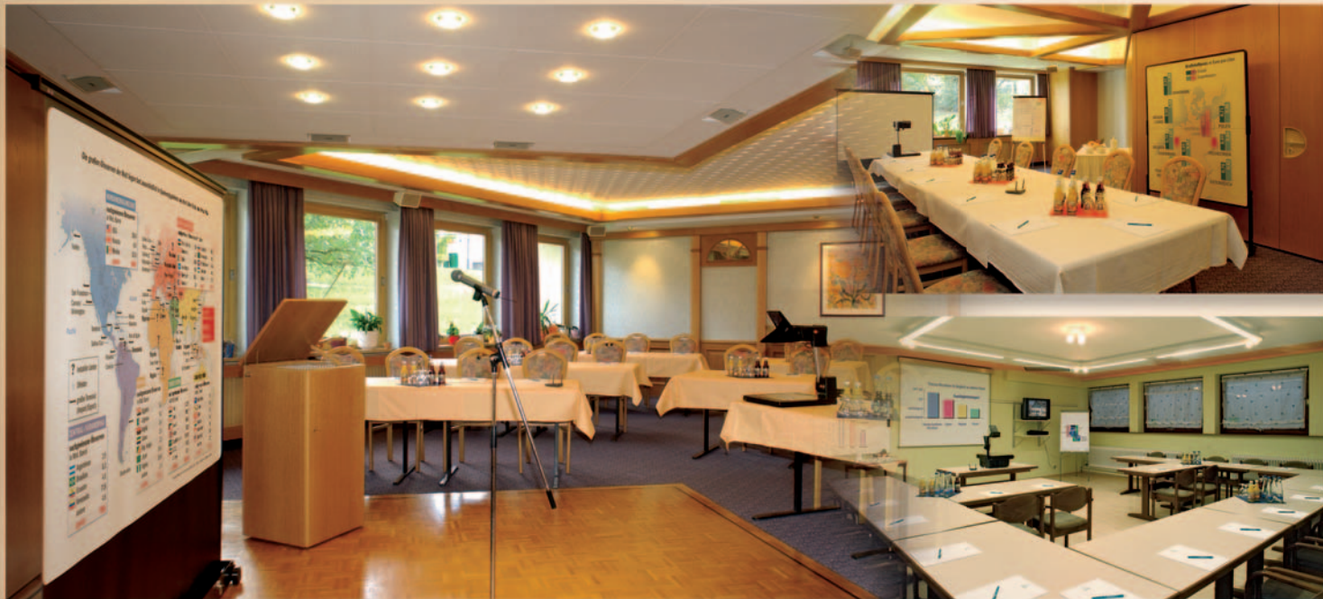
Bitte fordern Sie unsere individuellen Tagungspauschalen an