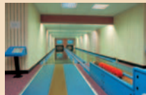
»Eine ruhige Kugel schieben«