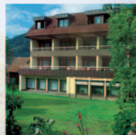
Rückansicht vom Haupthaus

Besitzer: Artur Schmieder Hauptstraße 100 • 77960 Seelbach Telefon: 07823/9495-0 Telefax: 07823/2036 eMail: info@ochsen-seelbach.de www.ochsen-seelbach.de